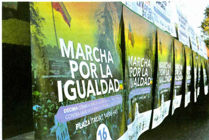
► Convocatoria a marcha contra la homofobia y transfobia durante 2015.

Encuesta sobre situación de personas trans en el país dice que el 41,3% reconoce su condición entre los cero y cinco años.