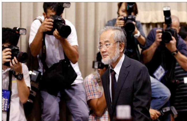
Ohsumi es profesor del Instituto de Tecnología de Tokio.