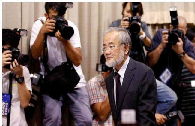
Ohsumi es profesor del Instituto de Tecnología de Tokio.