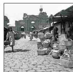
"Cestería en mimbre" , una escena cotidiana de Chillán, hacia 1940.

Una investigación realizada por el Archivo Patrimonial de la Usach , que desde 1972 conserva unas 3.000 piezas del fundamental autor chileno, derivó en la exposición "Oficio y Arte: El archivo de Antonio Quintana", que hasta el 25 de agosto se encuentra en el Espacio Ceccal , en Chillán. Son 40 imágenes en gran formato, muchas de ellas nunca exhibidas. "Se muestran distintas facetas de Quintana. Conoció mucho más por el proyecto 'El rostro de Chile' (1960), aquí podremos apreciar su mirada sobre la fotografía industrial, arquitectura moderna, vida cotidiana y naturaleza", dice Alejandra Pinto, coordinadora del archivo. "Además se exponen tiras de contacto (impresión con serie de negativos), con indicaciones del propio Quintana. Eso da señales de cómo trabajaba", agrega Felipe Coddou. Este 18 de agosto la Presidenta Bachelet entregará en La Moneda el Premio Antonio Quintana , en su segunda edición.