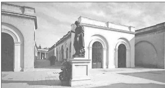
Silencio absoluto. El Cementerio General es uno de los espacios que el premiado autor chileno revisitó.