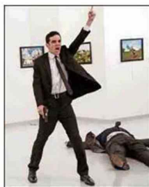
Momento dramático. Después de disparar y antes de ser abatido.