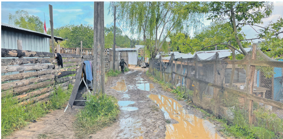
El campamento los Pirquenes de Coronel expuso la precariedad de lo que es vivir en estos asentamientos.