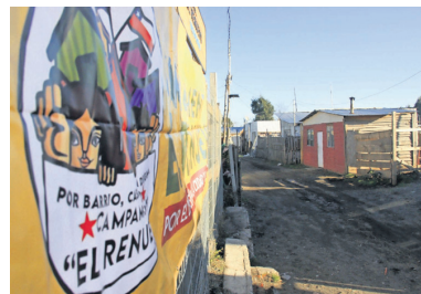
El Minvu espera, al menos, frenar las cifras al alza.

Por medio de la segunda estrategia, el Ejecutivo aborda la situación de los asentamientos