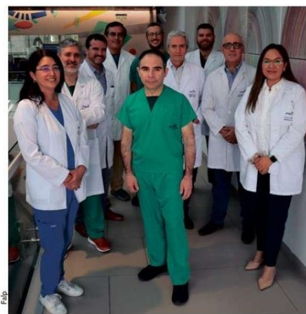
El equipo de tratamiento multidisciplinario de sarcomas FALP está conformado por especialistas en cirugía digestiva, cirugía vascular, cirugía traumatológica, radioterapia, oncología médica y anatomía patológica.

Revise un video sobre este tema con nuestros especialistas. Escanee el código QR acercando su celular con la cámara encendida.