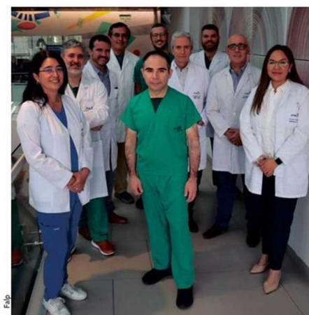
El equipo de tratamiento multidisciplinario de sarcomas FALP está conformado por especialistas en cirugía digestiva, cirugía vascular, cirugía traumatológica, radioterapia, oncología médica y anatomía patológica.

también tienen una alta posibilidad de curarse"