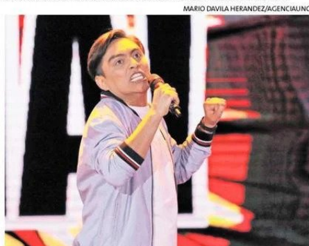
FREIRE VOLVERÁ A VIÑA DEL MAR EL 29 DE FEBRERO.