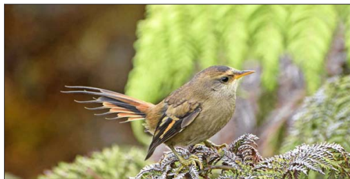
El rayadito ( Aphrastura spinicauda ) es un ave nativa de Chile que tiene plumas largas y la cola con su extremo “pelado”, es decir, sin barbas (componente de la pluma), lo que da la impresión de tener una cola espinosa.