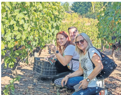
Sanroke es una de las viñas más premiadas de la Región del Biobío. En mayo de 2023, por ejemplo, la Guía Vinou destacó sus producciones al decir que "san vinos de calidad que comienzan a mostrar elegancia y algo de complejidad".

La comuna es rica por su patrimonio. De hecho, en mayo pasado el Consejo de Monumentos Nacionales aceptó por unanimidad la solicitud de declaración como monumento histórico nacional del Complejo Ferroviario de San Rosendo, en el contexto de los 150 años de la entrada en operación de la estación. La Casa de Máquinas, el Museo Ferroviario o el Puente Ferroviario sobre el río Laja son parte de las ruinas que dan cuenta de la historia industrial que en algún momento dio vida al sector.