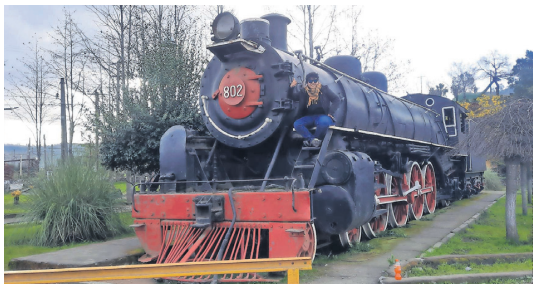
La locomotora "802" es parte del patrimonio a visitar en la ciudad. Fue construida por la empresa norteamericana Baldwin, en la década de 1920.