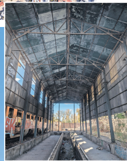
Parte de las ruinas que hoy dan valor a la historia ferroviaria de esta comuna de la Provincia de Biobío.

Los atractivos de una comuna que tuvo su origen en 1826