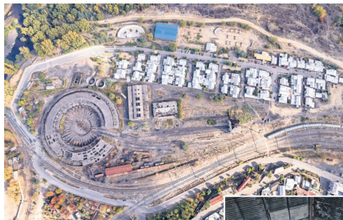
Siete construcciones componen el Complejo Ferroviario de San Rosendo, que fue clave para el desarrollo industrial y del transporte durante el siglo XX. Tuvo una ubicación estratégica que permitió unir los puertos locales con las zonas norte y sur.