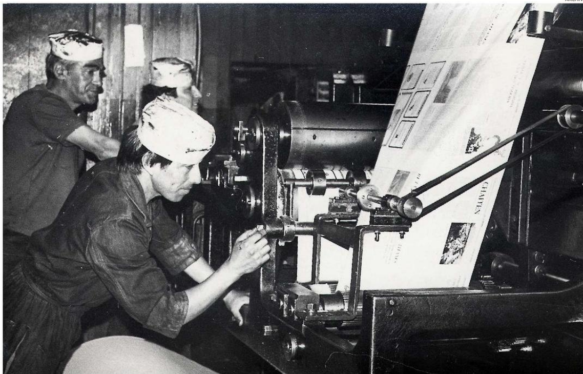
EN JUNIO DE 1989, EL LLANQUIHUE INSTALÓ UN EQUIPO DE PREIMPRESIÓN COMPUTARIZADO, CON LO QUE CAMBIÓ DE UNA TECNOLOGÍA DE IMPRESIÓN CALIENTE A UNA FRÍA.