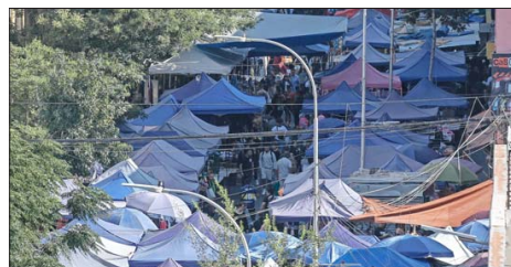
SIN CONTROL .— Así lucía el jueves pasado Meiggs, copado por los toldos azules del comercio ilegal.