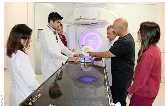
Capacitación en Clínica Las Condes.

El principal recinto público de la Región de Magallanes implementará un equipo de radioterapia de última tecnología de tipo Elekta, que le permitirá realizar radioterapia en diversos tipos de tumores y que beneficiará a prácticamente todos los pacientes oncológicos de la zona más austral del mundo, posibilitando efectuar