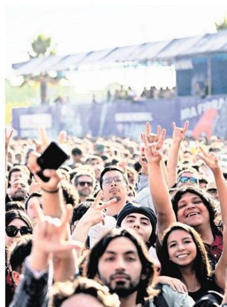
ACUSARON QUE LOS ESPACIOS VIP "ENCAJONABAN" AL PÚBLICO.

segregador a más no poder. Si el festival se gestiona con fondos públicos, entonces lo pagamos todos y todas, y nadie quiere estructuras enormes para el disfrute de unos pocos, arruinándole la experien-