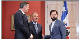
Gobierno y la nueva mesa de la Cámara Alta retoman el diálogo luego de los reproches de Boric por la votación.

Ante panorama en el Congreso: Posicionamiento del PC con llamado a movilizaciones e insistencia para la salida de Yáñez no tiene eco en La Moneda