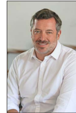
Sondeos lo dan como el más competitivo frente a Iraci Hassler.

Los subcampeones del mundo y su máxima estrella, Mbappé, impulsaron su jerarquía sin brillar demasiado en Marsella. Pese a ello, la selección chilena siguió mostrando signos de recuperación, con personalidad y orden táctico, en un nivel que abre esperanzas para su participación en la Copa América y las eliminatorias mundialistas. Entre los de mejor rendimiento estuvieron los autores de los goles, Marcelino Núñez y Darío Osorio. | DEPORTES 2 a 5