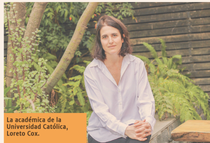
POR C. LEÓN Y A. SANTILLÁN

■ Un 59% del grupo se inclinó por esta alternativa. El apoyo es más evidente entre los expertos relacionados con la centroderecha.