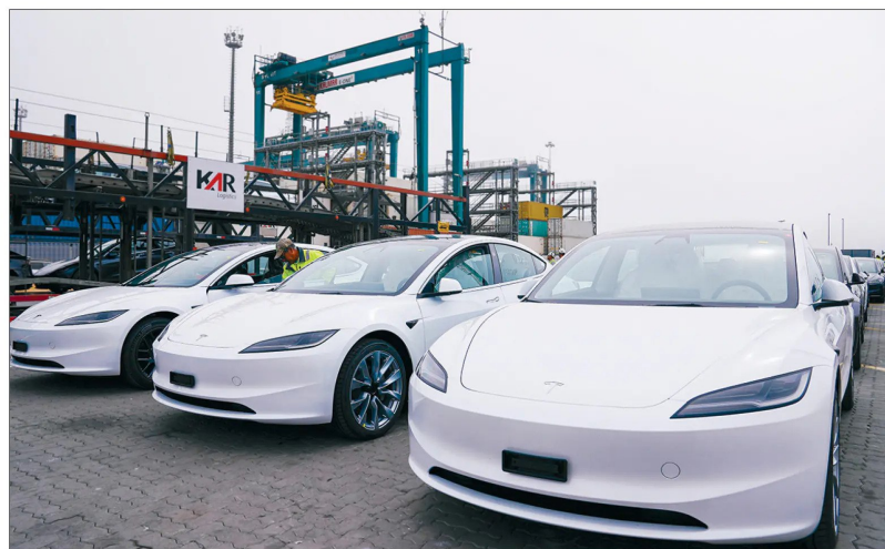
El fabricante ya ingresó 318 unidades de Model 3 y Model Y este año.

Los autos llegaron con carga suficiente para bajar andando del barco y subirse a los camiones transportadores.