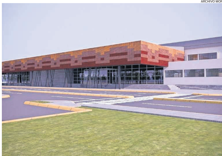
IMAGEN VIRTUAL DEL DISEÑO PARA LA OBRA LICITADA EN TRES OCASIONES. AHORA, SE DOBLÓ EL PRESUPUESTO.

Este es un proyecto de larga data. Ha tenido dos licitaciones fallidas. Y la tercera fue publicada en marzo de 2023 y adjudicada en febrero de 2024. Sin embargo, la oferta recibida (M$41.453.453) superaba el presupuesto oficial (M$21.343.000).