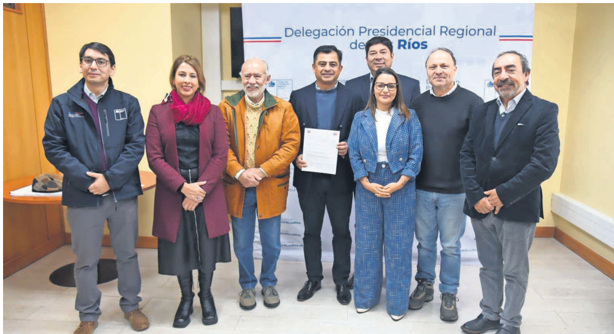
EN OCTUBRE DE 2024 SE DEBERÍA DAR INICIO AL INICIO DEL CONTRATO DE MEJORAMIENTO Y AMPLIACIÓN DEL AERÓDROMO. AUTORIDADES EXPLICARON ALCANCES DEL PROYECTO.

Parlamentarios y alcaldes coinciden en que más allá de esta contingencia, que debe ser resuelta, existe la necesidad del mejoramiento y ampliación del Aeródromo Pichoy.