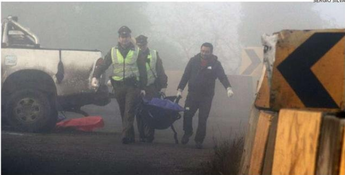
LOS CUERPOS DE LOS FALLECIDOS FUERON LLEVADOS AL SERVICIO MÉDICO LEGAL DE OSORNO.

dores fueron retirados pasadas las 8.30 de la mañana, luego de ser pericados por personal de la Subcomisaría Investigadora de Accidentes del Tránsito.