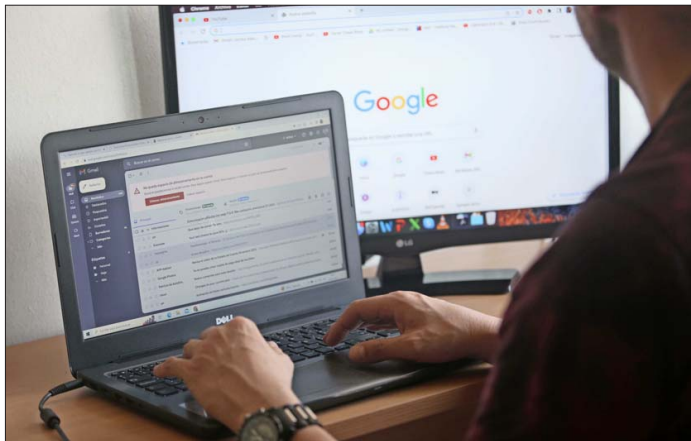
En Chile, un 33,2% mencionó la modalidad de trabajo como uno de los factores más relevantes a la hora de postular a un cargo.

La medición se llevó a cabo mediante encuestas en línea entre el 3 y el 18 de diciembre pasa-