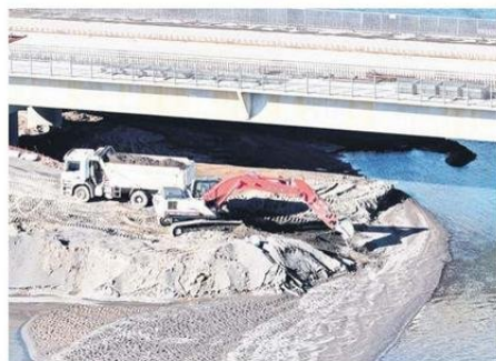
LA IDEA ES INVESTIGAR, Y SI ES NECESARIO, EXIGEN SANCIONES.

“Después de mucho rato, de haber recopilado bastante material, ingresamos estas denuncias por-