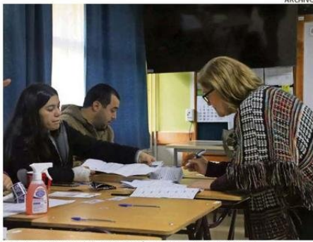
LAS ELECCIONES ESTE AÑO SERÁN EL 26 Y 27 DE OCTUBRE.

“Esto también está un poco al margen del movimiento feminista, que tuvo un punto muy alto hace un par de años, pero que cada vez está más silenciado. Esto sucede porque a veces las candidaturas de mujeres no recogen lo que sus pares quieren y priorizan más sus pensamientos personales. Eso ha pasado la cuenta en diversas áreas y en política no es la excepción. Ahora, que las mujeres en cargos públicos son un aporte y tienen muchas capacidades para realizarlos, no cabe duda; pero existe un trecho importante que recorrer no solo en la región, sino en el país y el mundo”, argumentó. ☞