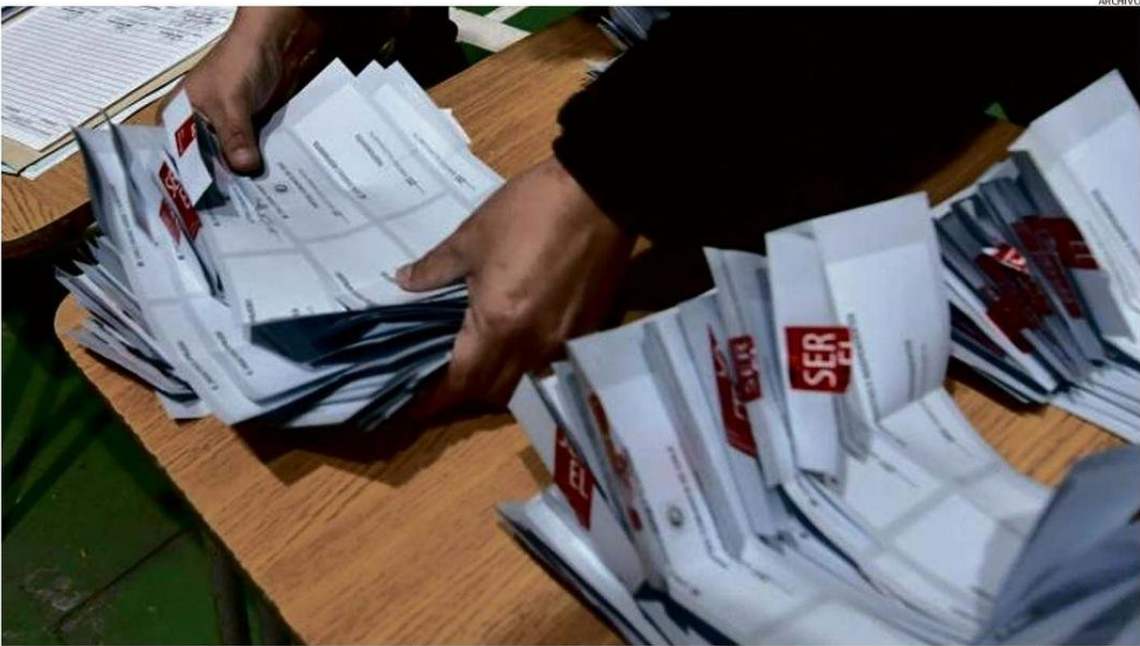
PARA LAS ELECCIONES A REALIZARSE EL 26 Y 27 DE OCTUBRE, SERÁN 393 MUJERES LAS QUE BUSCARÁN SER ELECTAS EN LOS CUATRO PROCESOS QUE SE DESARROLLARÁN ESOS DÍAS.

Esta realidad, visible para los habitantes de la Región de Los Lagos, también se replica en otras partes del país y de Latinoamérica, donde históricamente ha existido una baja par-