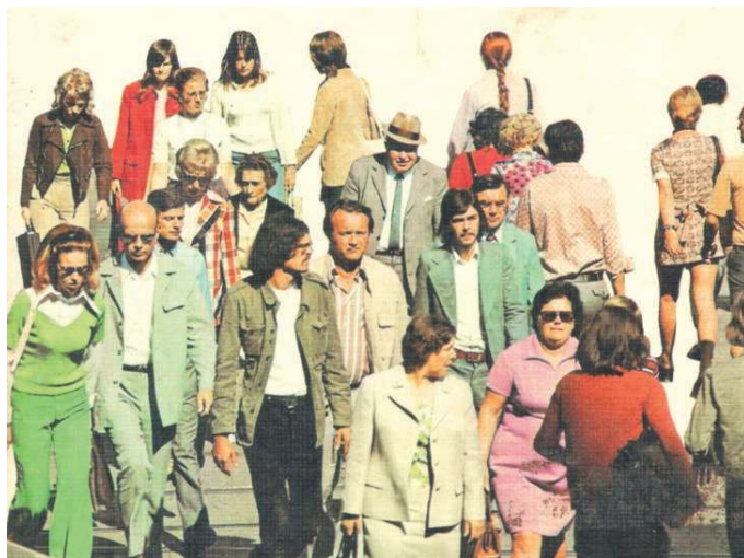
Cotidianamente somos bombardeados por una sociedad consumista -de la que somos parte- que privilegia un materialismo alienante.

Compartir algunas meditaciones sobre nuestra existencia, sobre el por qué, para qué y hacia dónde vamos, es desnudarnos como entes pensantes. Para este articulista son -además- valiosas e irremplazables reflexiones que nos ayudan en nuestra evolución personal y social