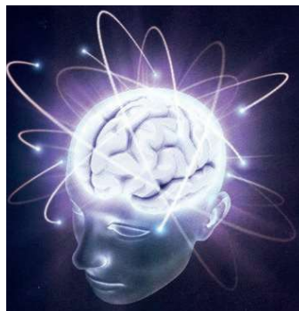
Cualquier miedo que se tenga, aunque sea por una cosa sencilla, en el fondo es miedo a la muerte. Y el ego sabe que surge y se forma en la materia, en la mente. El miedo es expresión del Ego.