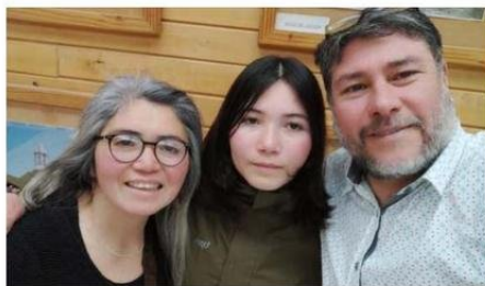
LA BRILLANTE ESTUDIANTE JUNTO A SUS PADRES.

“Los municipios de Dalcahue y Castro están interesados en esta aplicación y hemos tenido conversaciones al respecto, lo que nos tiene muy contentos”, agre-