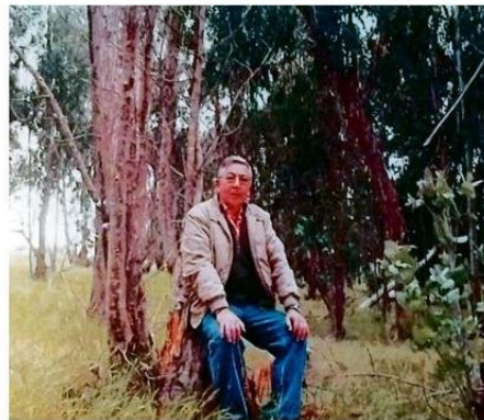
EL ESCRITOR EN EL SECTOR DE PELANCURA.

Luego regresa a Chile y se va a vivir a Capilla del Monte, en su persecución de avistamientos de ovnis; retornó a Cartagena, cerca de una propiedad donde pa-