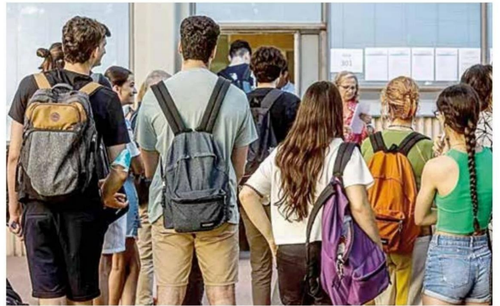
Luego de dar la PAES, los estudiantes pudieron postular a la gratuidad y otras becas en el FUAS.

Una vez cumplidos estos requisitos, los estudiantes que postulan a los beneficios, especialmente a la gratuidad, deben cumplir algunos pasos, los que varían mínimamente si son alumnos nuevos que postulan por primera vez, o estudiantes antiguos con o sin becas vigentes, y los alumnos antiguos que ya cuentan con la gratuidad. En rigor, los alumnos nuevos,