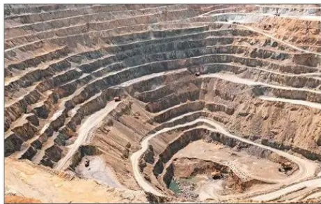
La producción minera aumentó 2,2% respecto de noviembre del año pasado y retrocedió en relación con octubre en -0,3% en la serie desestacionalizada.

12,7% en vestuario, calzado y accesorios; 8,7% en bienes de consumo diverso, y 4% en alimentos.