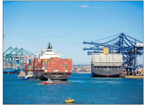
Tomás Flores (LyD) señala que el valor de las exportaciones locales se ha multiplicado unas 27 veces en relación con las cifras de 1984.

un superávit comercial de US$ 22.100 millones en 2024, es decir, cerca del 7% del PIB, según consignó ValorFuturo. La entidad brasileña destacó que la última vez que se registraron superávits comerciales anuales de tales magnitudes fue en el período 2006-2007.