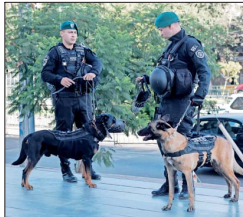
En medio de un riguroso operativo de seguridad se efectúa la formalización de cargos de cinco integrantes de la organización criminal, en el Centro de Justicia.

Banda de "Los Piratas" Desde secuestros planeados por WhatsApp hasta asesinatos por desobediencia: las brutales prácticas de la organización detrás del crimen de Ojeda