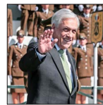
De concretarse la iniciativa, sería el exmanifiesto que obtendría más rápido el reconocimiento.

Cuestionan uso de recursos de la entidad: recibe $47 millones al mes y tiene 16 funcionarios, pese a estar inutilizable hace más de cinco años. | C 5