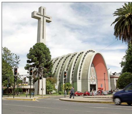
Once regiones anotaron retrocesos en su tasa promedio anual de desempleo respecto de 2023. En Nuble (cuya capital es Chillán, en la imagen) y La Araucanía promedió 10% en 2024.

2 Si bien el empleo formal lidera en la creación de puestos de trabajo, el dinamismo de este tipo de empleos sigue bajo y es por ello que la tasa de desempleo sigue muy alta en términos históricos. "Es preocupante la desaceleración del crecimiento en la ocupación en