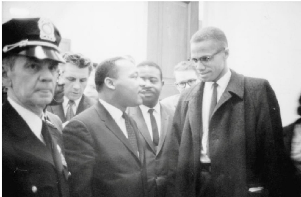
► Martin Luther King Jr. y Malcolm X esperan el inicio de una conferencia de prensa, el 26 de marzo de 1964.

La cárcel y el giro inesperado Pese a ser un estudiante brillante, cuando tenía unos 15 años abandonó la escuela secundaria. El motivo fue que cuando le comentó a uno de sus profesores, un hombre