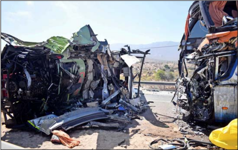
Las personas que pedían ayuda lo hacían con las luces de sus celulares. A pesar de eso, el chofer del segundo bus Pullman no vio al bus volcado y lo embistió.