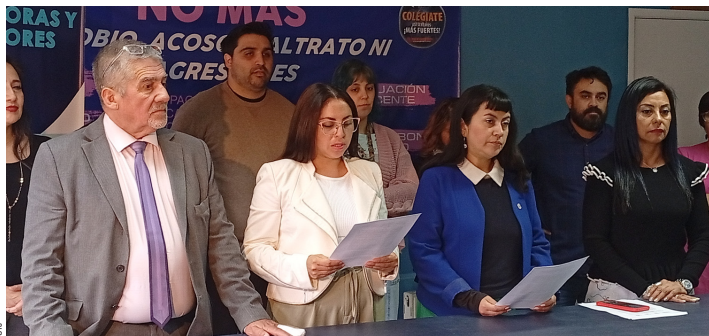
Profesores manifestaron que se mantienen firmes y en pie, por su demanda laboral.

● Colegio de Profesores y sindicatos 1 y 2 de profesionales de Puerto Natales, plantearon que será posible avanzar con un reajuste salarial con la modificación del artículo 47 del Estatuto Docente.