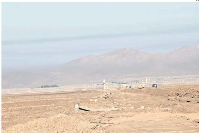
ESTA SEMANA FUERON 60 POSTES LOS QUE RESULTARON DAÑADOS POR LOS ROBOS.

Sobre el fiscal especializado, Peña explicó que se trata de un persecutor de la unidad SACFI de la Fiscalía Regional, quien ten-