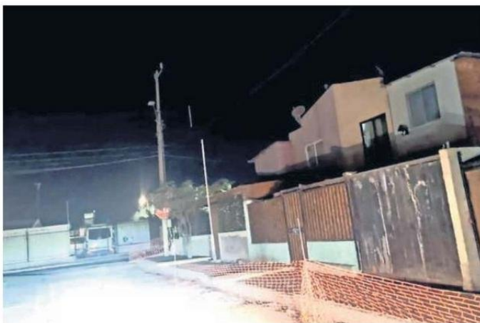
CASI UNA SEMANA SIN LUZ TENDRÁN LOS VECINOS DE SIERRA GORDA.

“Estas organizaciones suelen ocultar por un tiempo el producto sustraído y posteriormente lo trasladan a otras regiones”