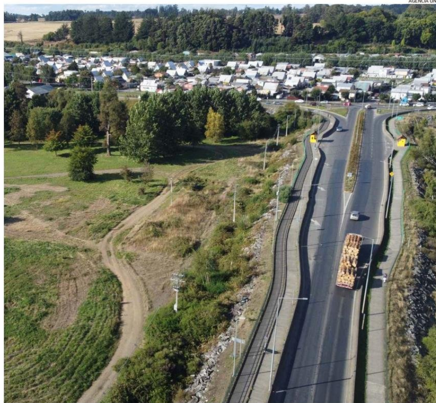
FRANCHE CONCENTRA UNA GRAN CANTIDAD DE HABITANTES, QUIENES EN SU MAYORÍA SE DESPLAZAN AL CENTRO PARA TODO.

Por otra parte, Cancino señaló que el sector también enfrenta otro problema: la poca cantidad de recintos de salud.