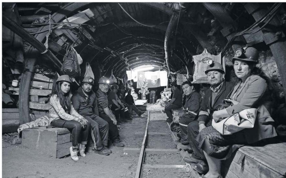
Las condiciones humanas, personales, como también los anhelos incumplidos son parte de las temáticas del nuevo documental de Palma.

dera que tiene características medicinales", ilustra el realizador, cuya tercera obra, "Las cruces" (2022) se interna durante 25 minutos en el cementerio de los desaparecidos en el mar, en el cerro Los Lobos, en Talcahuano.