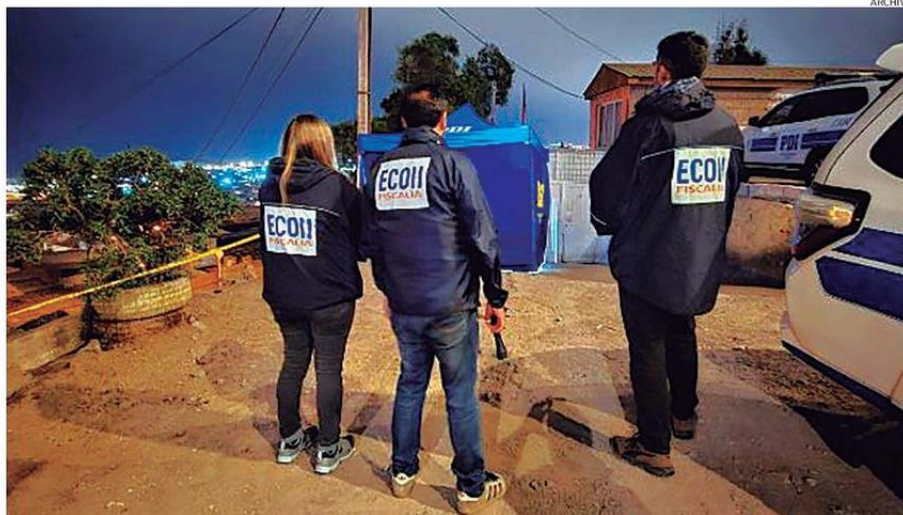
LA MAYORÍA DE LOS HOMICIDIOS OCURRIDOS EN EL AÑO 2024 SON EN LA VÍA PÚBLICA, REPRESENTANDO EL 58% DE LOS CASOS.

50 homicidios consumados se registraron en la región el 2024, en comparación con las 59 víctimas del 2023.