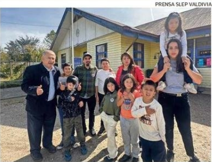
NUEVE ESTUDIANTES ASISTEN A LA ESCUELA DE PISHUINCO.

rurales existen en las ocho comunas de la Provincia de Valdivia que administra el SLEP. Ellos constituyen el 43% del total de escuelas, liceos y jardines dependientes del Servicio.