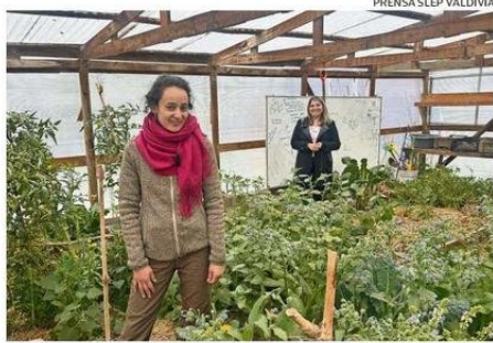
EN LAS ESCUELAS DE PISHUINCO Y REUMÉN SE DESARROLLAN TALLERES VINCULADOS AL MEDIOAMBIENTE Y EL DESARROLLO PERSONAL DE LOS NIÑOS Y NIÑAS, ADEMÁS DE COLABORAR CON LAS COMUNIDADES.