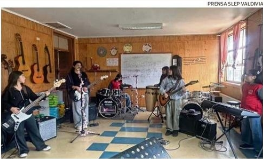
LA ESCUELA ROT DE REUMÉN TIENE TALLERES ARTÍSTICOS PARA ESTUDIANTES.