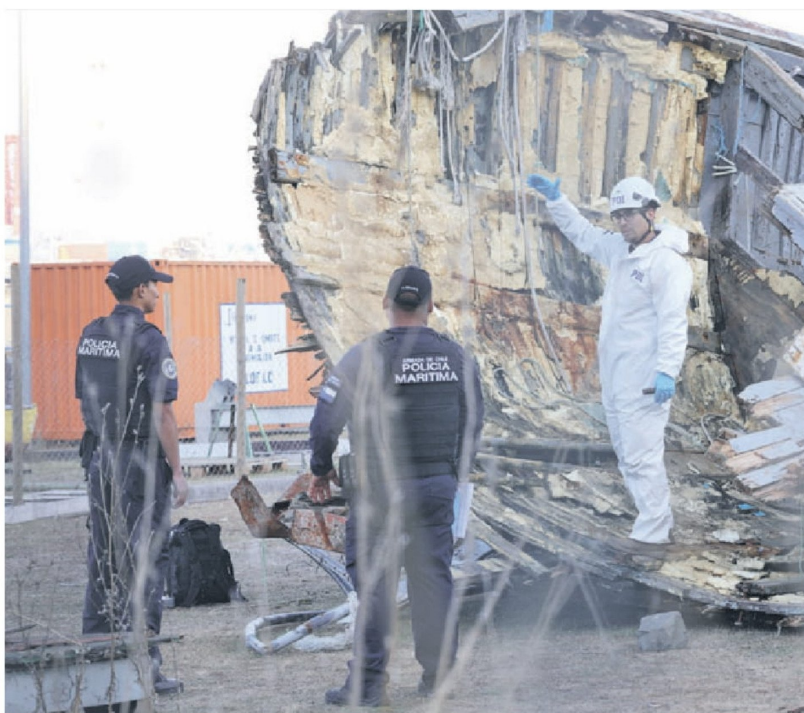
► La proa de la embarcación Bruma, en Talcahuano.

pecializada, incluyendo un robot submarino propio con capacidad de descenso hasta los 350 metros, además de embarcaciones y personal técnico para colaborar en las labores de rastreo.