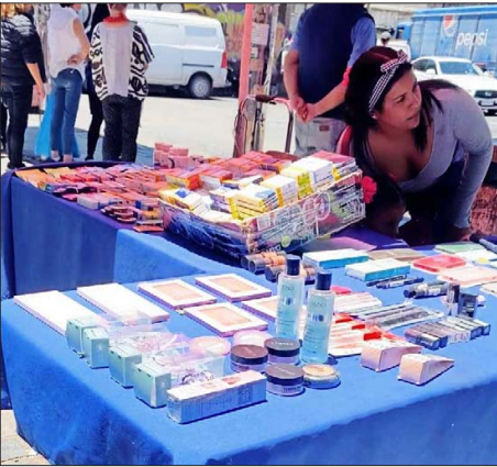
Ante el riesgo de comprar fármacos en locales no establecidos, el año pasado el Gobierno lanzó una campaña contra la venta ilegal de los medicamentos.

“Antes se podía pensar que eran personas individuales que vendían. Hoy se ha revelado que es una red criminal que abastece a una gran cantidad de personas”.