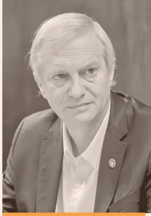
JOSÉ ANTONIO KAST, PARTIDO REPUBLICANO.