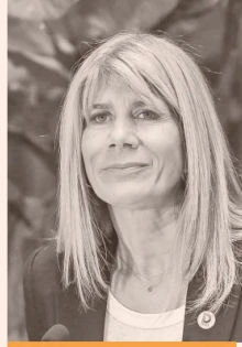
XIMENA RINCÓN, PARTIDO DEMOCRÁTAS.