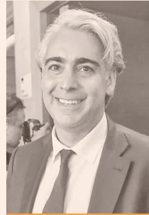
MARCO ENRÍQUEZ-OMINAMI, PARTIDO PROGRESISTA.