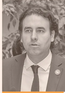
VLADO MIROSEVIC, PARTIDO LIBERAL.