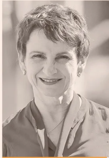
CAROLINA TOHÁ, PARTIDO POR LA DEMOCRACIA.