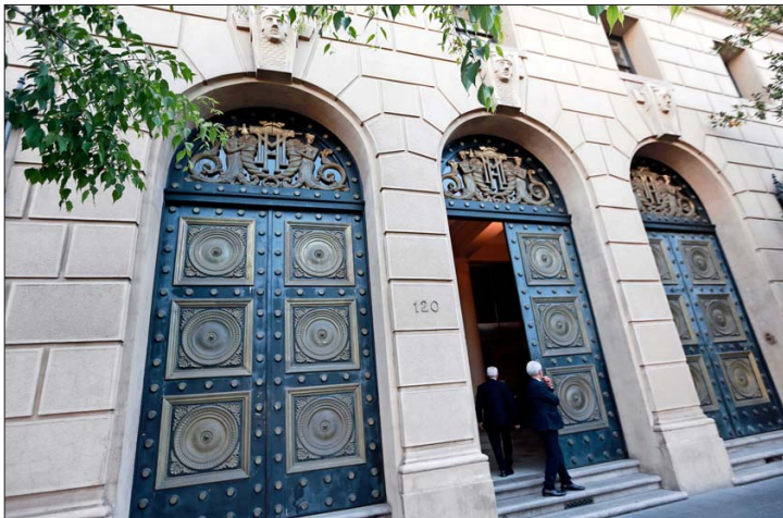
A finales de 2023 el Ministerio de Hacienda, como parte de las conversaciones por el pacto fiscal, presentó el estudio del SII sobre evasión, que ahora tuvo que ser corregido.

A juicio de expertos, una menor brecha haría más difícil lograr ingresos por 1,5% del PIB, que estimó el Gobierno para financiar, entre otros temas, el aumento de la PGU.