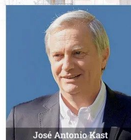
José Antonio Kast

Sus primeras medidas serían reducir la carga tributaria para empresas y personas, desarrollar infraestructura privada y pública, y atraer inversiones extranjeras con incentivos.