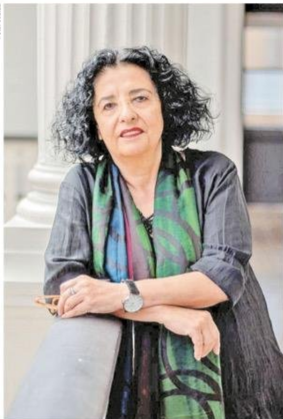
En 2007 recibió, de forma unánime en el jurado, el Premio Nacional de Periodismo, por su vasta trayectoria en el quehacer periodístico chileno.

Faride Zerán sobre el gobierno de Gabriel Boric