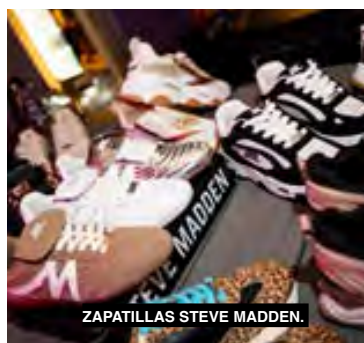
ZAPATILLAS STEVE MADDEN.