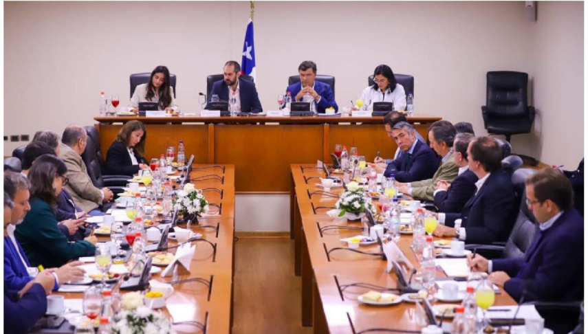
FEDEFRUTA F.G. HA ADVERTIDO que las restricciones impuestas por Estados Unidos van en desmedro de productores y trabajadores, por lo que han buscado mirar a nuevos mercados.

El objetivo principal para Catán en la instancia es “estrechar lazos en beneficio de la fruticultura de nuestro país”, para lo cual ha participado en importantes encuentros del sector tanto en el Ministerio