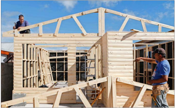
ANGUSTIA. — Los afectados por el megaincendio se preparan para vivir un nuevo invierno en mediaguas o viviendas precarias construidas por sus propios medios.

Oficina Atisba estudió imágenes del 22 de febrero pasado, recién liberadas por Google Earth: