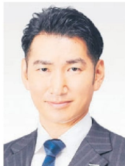
Haruki Satomi, CEO del grupo japonés Sega, dueño de Coolbet.