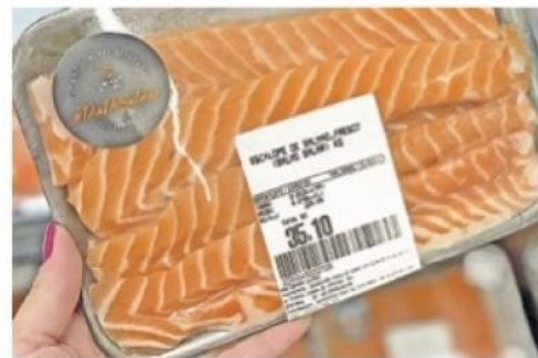
El salmón, principal producto exportado desde la Región de Magallanes al gigante sudamericano.