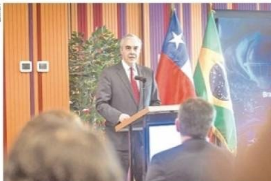
El embajador de Brasil en Chile, Paulo Pacheco.

Dentro de las explicaciones por la alta demanda del gigante sudamericano de este pescado, destacó la influencia cultural: "En Brasil es-