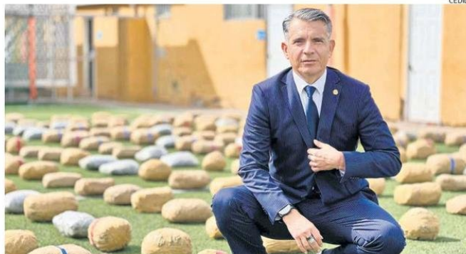
CASTRO BEKIOS ABORDÓ LOS RIESGOS QUE ABORDA LA REGIÓN EN MATERIA DE SEGURIDAD CON EL CORREDOR.