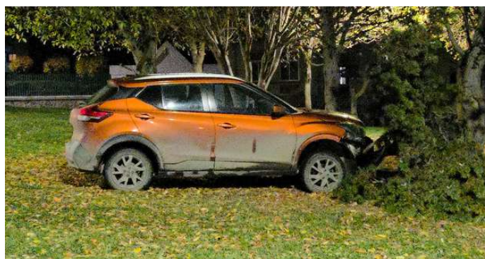
Los ocupantes de un vehículo lo dejaron abandonado luego de impactar contra un árbol en el bandejón de Avenida España.