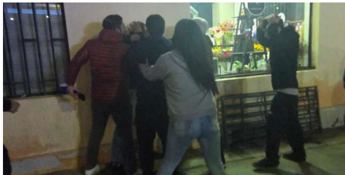
La rabia se apoderó de estas personas, quienes agredieron a uno de los conductores involucrados en un accidente ocurrido la noche del viernes.