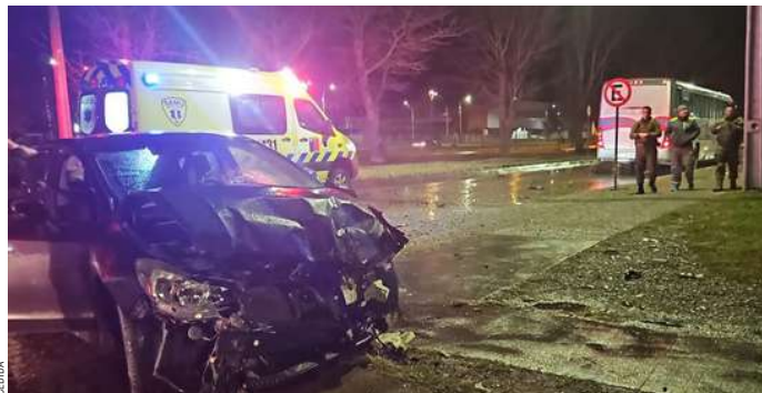
Un bus del Ejército fue colisionado por un auto particular, acudiendo personal del SAMU al sector.